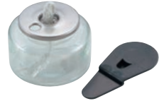
① ヒートエースα スタンダード 6H

③ 専用漏斗を使って燃料を補充します。(補充キャップをお使いいただくとう便利です。)