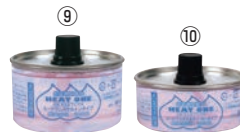
⑨ ⑩ ヒートワンスケルトン (36入)