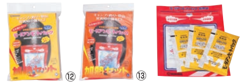
⑫ ⑬ モーリアン ヒートパック ハイパワー 加熱セット