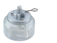
③ ヒートエースα デラックス 6H