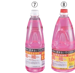
⑦ ⑧ 暖暖 (保温用液体燃料)