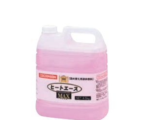
⑥ ヒートエースマックス 詰替専用 液体燃料 4ℓ